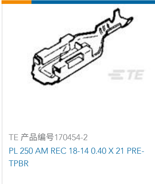
TE 产品编号170454-2 PL 250 AM REC 18-14 0.40 X 21 PRE-TPBR