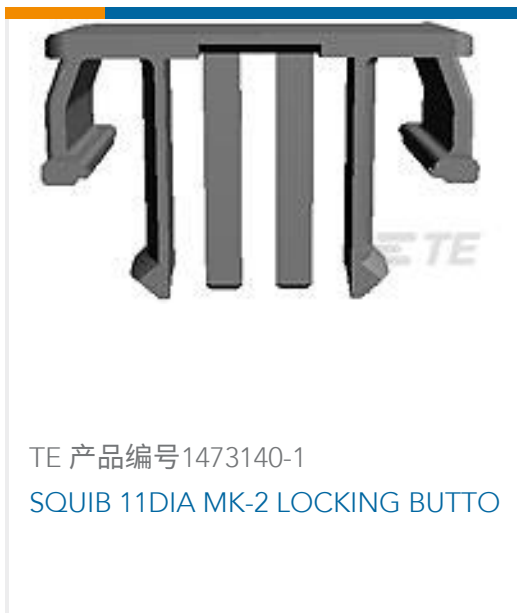
TE 产品编号1473140-1 SQUIB 11DIA MK-2 LOCKING BUTTO