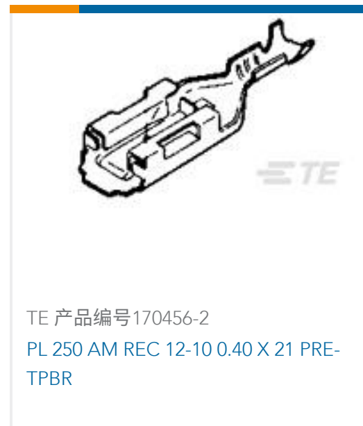
TE 产品编号170456-2 PL 250 AM REC 12-10 0.40 X 21 PRE-TPBR