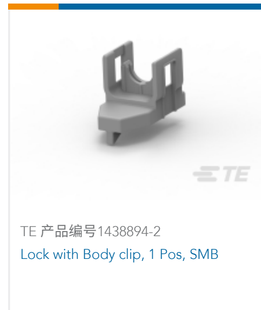
TE 产品编号1438894-2 Lock with Body clip, 1 Pos, SMB