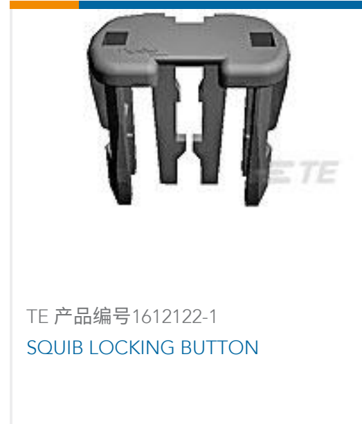
TE 产品编号1612122-1 SQUIB LOCKING BUTTON