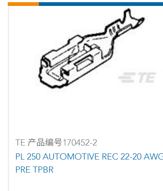
TE 产品编号170452-2 PL 250 AUTOMOTIVE REC 22-20 AWG PRE TPBR