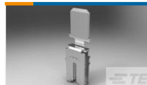
TE 零件编号63425-1 MAG MATE 250F TAB #12 TPBR.