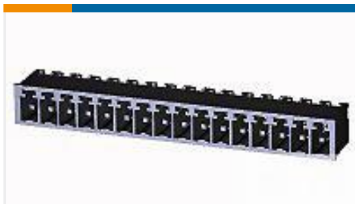
TE 零件编号796694-7 7 POS TERMI-BLOK HDR DIR. POL.