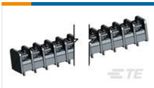
TE 零件编号5-1437664-2 NC6-P108-17=NC6 SERIES TERMINA